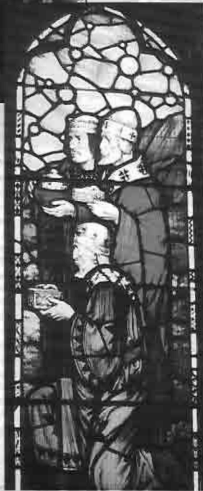
Vitraux de la Iglesia Presbiteriana San Andrés de Temperley