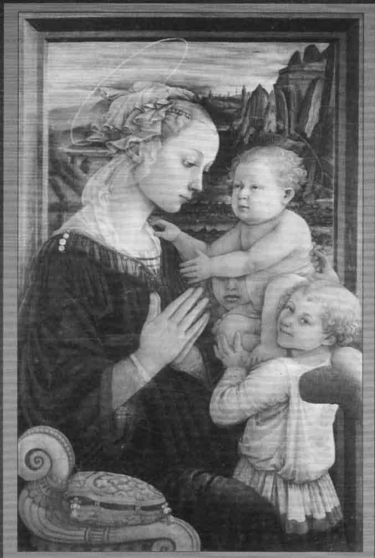
La Virgen y el Niño con dos ángeles Fra Filippo Lippi (1406-1469)